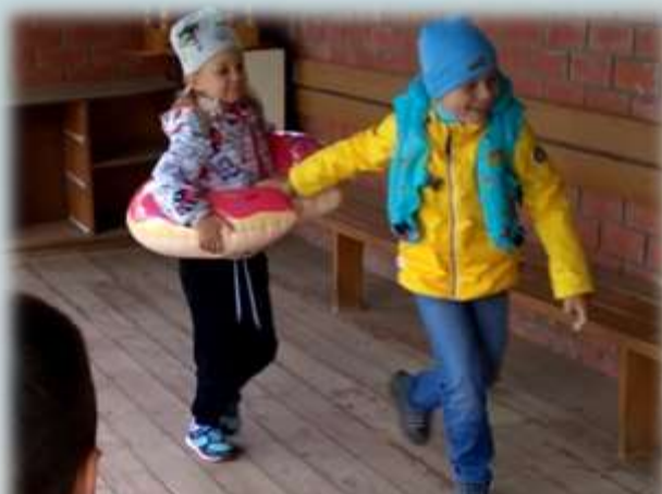
Тренинг «Безопасность на воде»