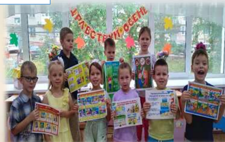
По итогам квеста дети создали альбомы безопасности Охват 97 воспитанников