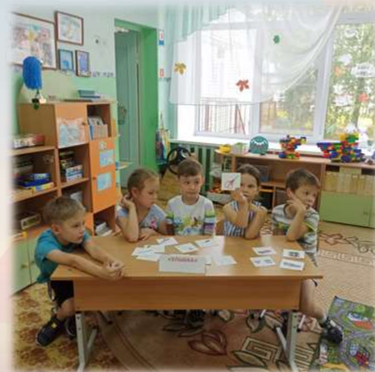
Брейнг-ринг «Знатоки безопасности»