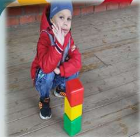
Тренинг «Светофор наш лучший друг»