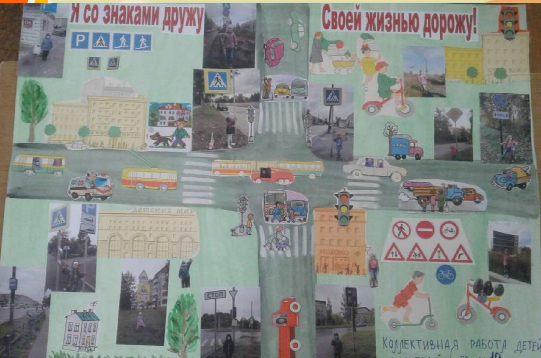
Выпуск групповой газеты