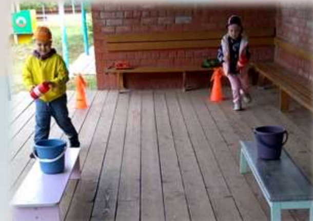
Спортивные состязания «Пожарные учения»