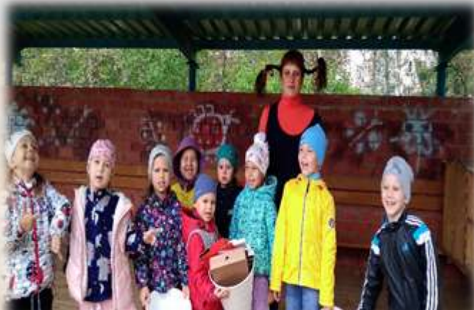
Тренинг «На лесной полянке»