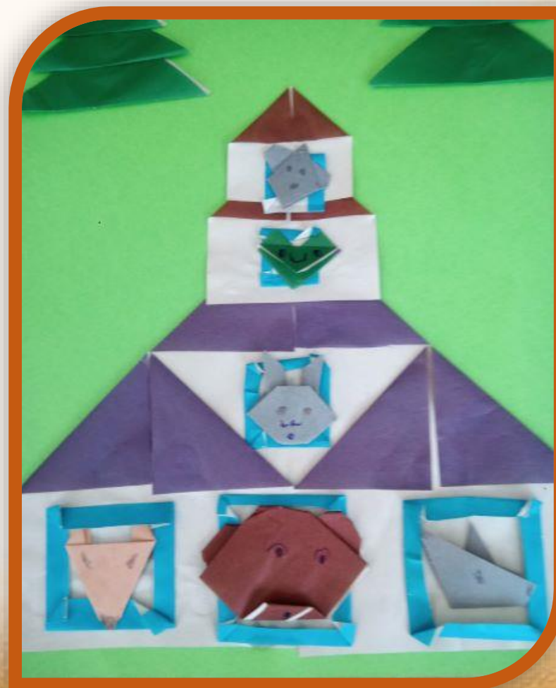
АППЛИКАЦИЯ – ОРИГАМИ ПО СКАЗКЕ «ТЕРЕМОК»