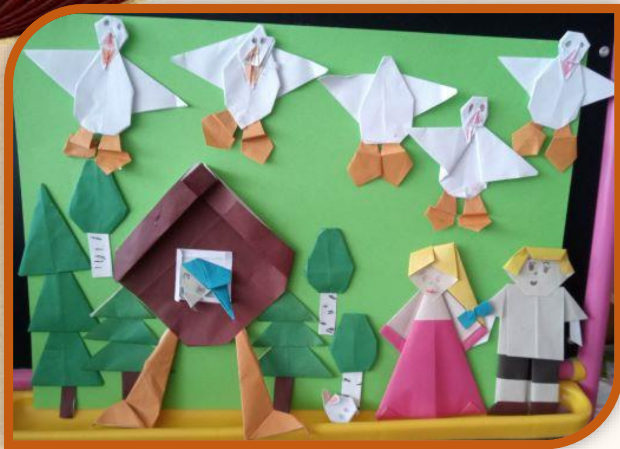
АППЛИКАЦИЯ – ОРИГАМИ ПО СКАЗКЕ «ГУСИ – ЛЕБЕДИ»